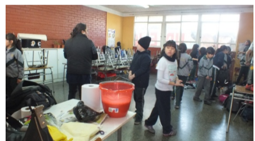
¡Profesores y alumnos aseando sus salas!

Día del Aseo. El día viernes 26 de junio, en el Colegio San Felipe realizamos el Día del Aseo. Se organizaron los diferentes cursos y limpiaron sus correspondientes salas de clases: Bancos, pisos, pizarras, ventanas, etc. Todo esto inspirado como una de las acciones del PME. El balance general fue positivo, ya que participaron entusiasta y ordenadamente alumnos y profesores... ¡Felicitaciones a todos por la toma de consciencia de mantener limpio nuestro entorno! ¡El desafío es que esto se convierta en "cultura" en nuestro colegio!