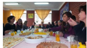
¡Hmmm! ¡Un delicioso desayuno!

¡Feliz Día del Profesor! Como una forma de agradecimiento y cariño por su labor, los alumnos y alumnas de 4º Año Medio homenajearon a sus profesores con un desayuno , en el comedor de nuestro establecimiento. Este ágape fraterno es algo tradicional. Este 16 de octubre hubo un ambiente de alegría y participación. Todos estábamos contentos al deleitar los ricos queques, torta, kuchen, galletas, sandwich, etc., acompañados con unos deliciosos jugos, café o té, según el paladar de los festejados. ¡Todo estuvo muy rico! ¡Gracias por su cariño y preocupación!