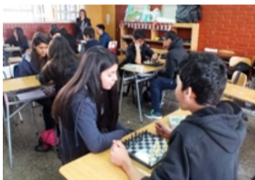
Alumnos de 8º Básico jugando ajedrez

"Existen Muchos materiales que pueden ayudar a su hijo(a) a aprender este segundo idioma, entre los cuales se encuentran CD-ROM, videojuegos, videos, DVD, CD de música, etc. También, hay una gran variedad de libros, programas de dibujos animados, por supuesto internet, y así incentivarlos por el idioma Inglés."