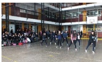
Presentación de 7º Año Básico

Presentación del Día del Profesor. El día 16 de octubre realizaron los alumnos y alumnas una Presentación para homenajear a sus profesores, en su día. Se destacó la participación de los estudiantes de 6º y 7º Año Básico con sus bailes y coreografías... ¡Felicitaciones! Al mismo tiempo, los profesores de Educación Física realizaron una revista de gimnasia con sus alumnos de Enseñanza Básica y Media. Esta presentación se basó fundamentalmente en coreografías estilo cheerleader y ejercicios de salto en el caballete.