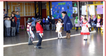
¡Alumnos de Kinder realizando el baile de la cueca durante el Acto Cívico!

Este Acto Cívico está calendarizado anualmente por la Unidad Técnica Pedagógica. Cada curso se hace cargo de realizarlo semanalmente. Cabe destacar que la realización de estos actos forma parte del currículo escolar y está orientado al desarrollo de aprendizajes.