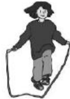
saltar la cuerda