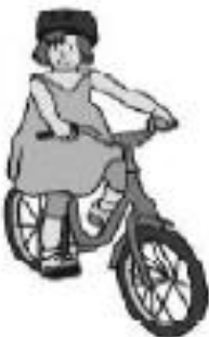
andar en bicicleta