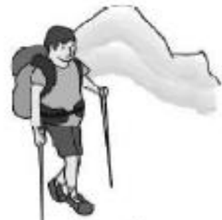
subir el corra