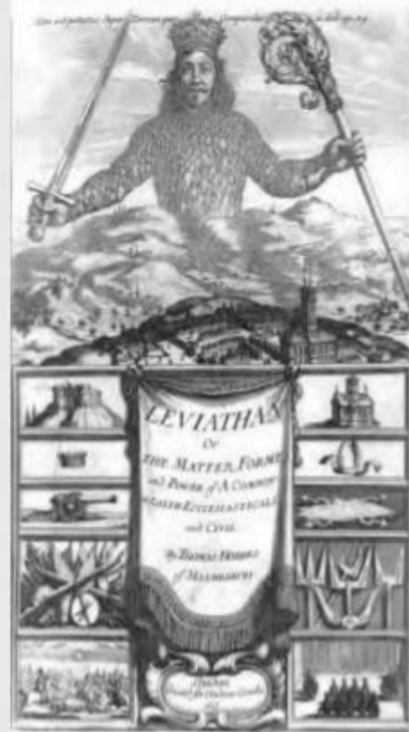
► Portada de la primera edición de Leviatán (Inglaterra, 1651).

Hobbes, T. (1651). Leviatán . Inglaterra. (Adaptación).