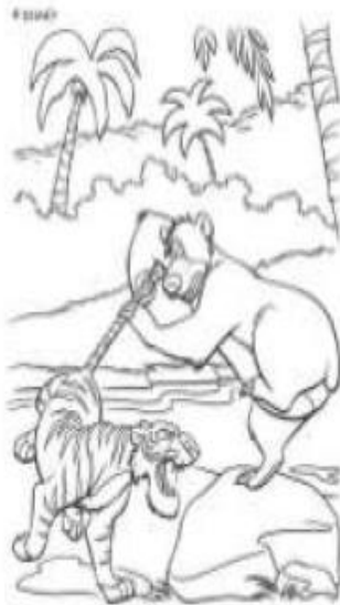
Ecosistema de selva