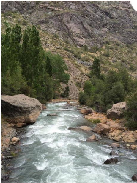
Río Blanco, Los Andes