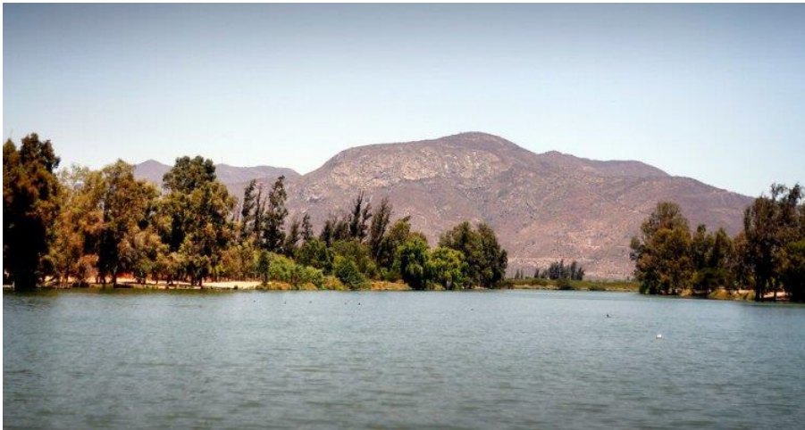
Laguna Carén Reg. Metropolitana