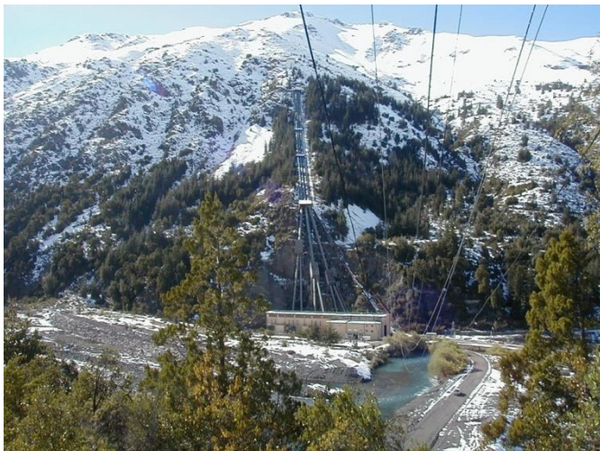
Central Hidroeléctrica Cipreses, Maule