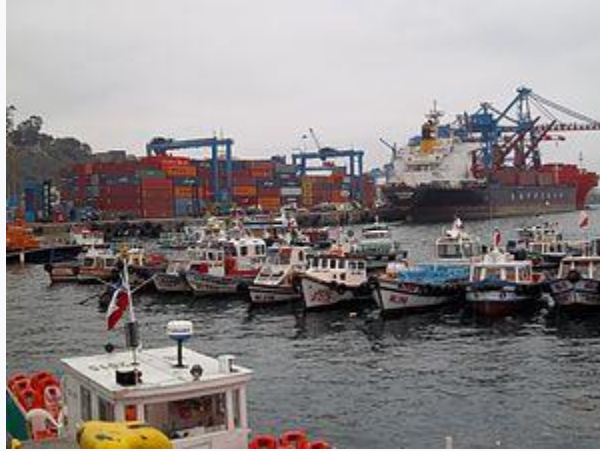
Puerto de Valparaíso.

Su economía mezcla la extracción de recursos naturales, a través de la explotación forestal, la agricultura, la pesca y la industria.