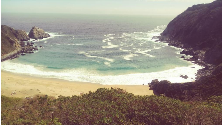
Laguna Verde Valparaíso