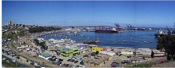
Puerto de San Antonio.