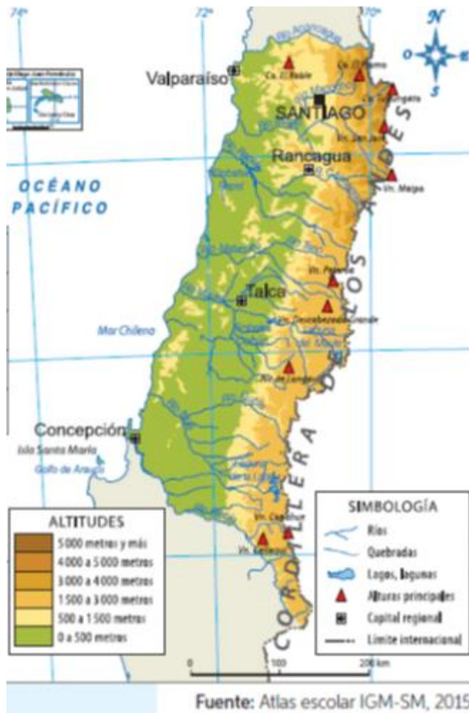
Mapa Físico de la Zona Central