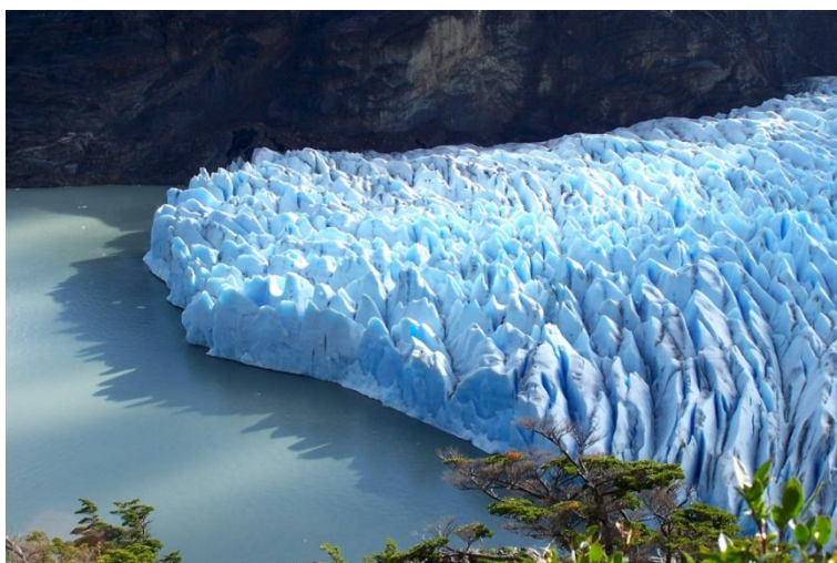
Campos de hielo sur.

Aguas Superficiales: Se aprecian grandes lagos y campos de hielo, los ríos nacen en la parte oriental de los Andes y poseen grandes caudales.