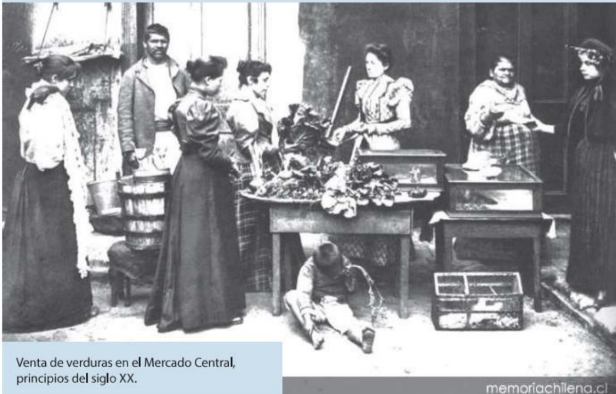
Venta de verduras en el Mercado Central, principios del siglo XX.