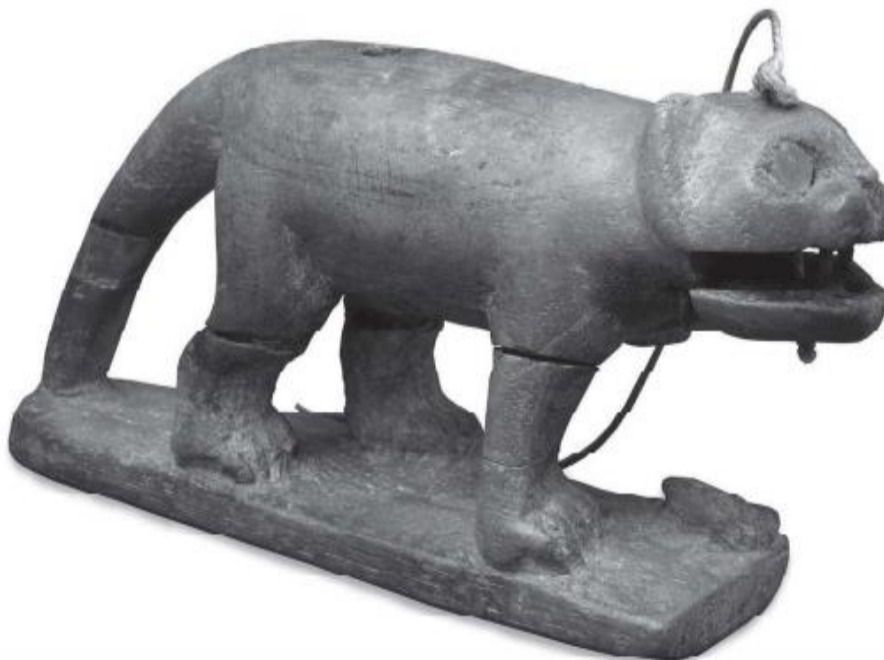
Juguete. Antiguo Egipto.